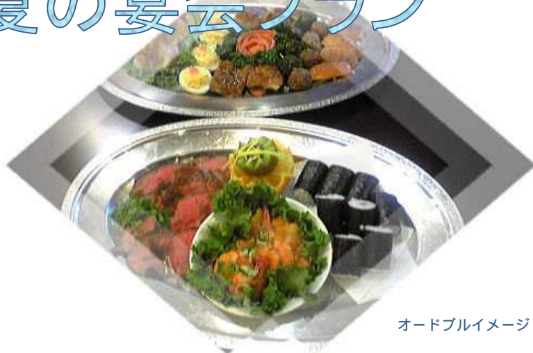
オードブルイメージ